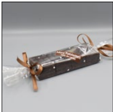
MINI TABLETTES CHOCOLAT NOIR. 100G Sans lécithines