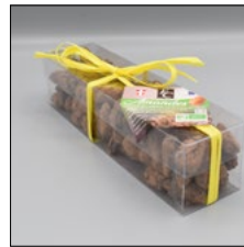
AMANDES CARAMÉLISÉES CHOCOLATÉES. 200G