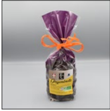
GINGEMBRE. 150G Sans lécithines

(disponibles du 15 novembre au 1 er avril)