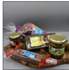
PLANCHE À DÉCOUPER EN BOIS GARNIE

À garnir en fonction de vos goûts et vos envies parmi tous les produits présents dans le catalogue.