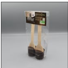
BÂTONNET CHOCOLAT NOIR. 60G