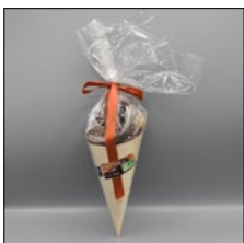
FRITURES CHOCOLAT LAIT. 100G