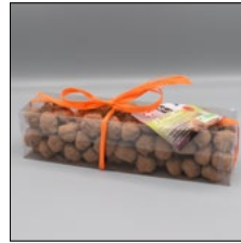
NOISETTES CARAMÉLISÉES CHOCOLATÉES. 200G