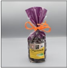
CITRONNETTE. 150G Sans lécithines