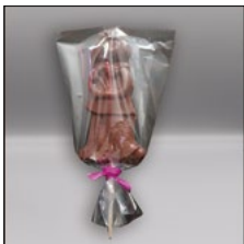
SUCETTE CHOCOLAT LAIT. 35G