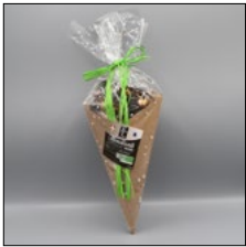
MENDIANTS LAIT. 150G