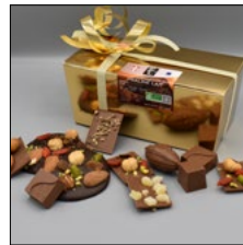
ASSORTIMENTS PRALINÉ LAIT