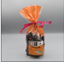
ORANGETTE. 150G Sans lécithines